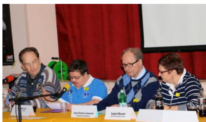
Photo mars 2014: SHM au congrès « Au fond qui décide ? » sur le thème de l'autodétermination

Bravo à Solidarité-Handicap mental pour son engagement exemplaire et merci d'avoir partagé ses projets avec les nôtres.